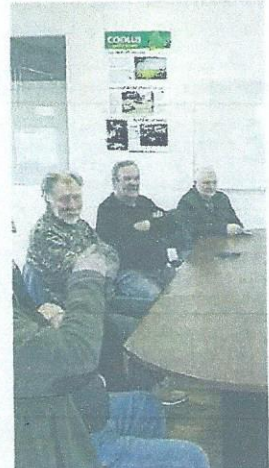
Les pêcheurs sont satisfaits du niveau de la Coole, mais mécontents de certains aménagements.

La rivière La Coole était à sec au mois de juillet mais grâce aux pluies des derniers mois, elle a retrouvé un niveau acceptable, selon les amateurs de pêche. Les pêcheurs sont en revanche toujours mécontents de la démolition de la passe à poissons, et précisent que l'ancien lit était beaucoup plus sauvage. Ils pointent aussi les cuillères qui restent accrochées dans le géotextile des nouvelles banquettes.