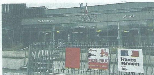
L'entrée du pôle ne se fera plus par la porte principale, le temps de procéder aux travaux.

Le sol actuellement souple sera remplacé par un matériau plus robuste. Le tout pour un montant de 75 000 euros, qui a fait réagir les élus lors de la réunion du conseil. « On va toucher de l'argent de la part de l'assurance », a tenu à préciser l'édile, dans le cadre de la garantie décennale de ce bâtiment récent, inauguré il y a tout juste